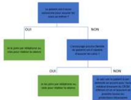
Arbre décisionnel Collège MK

Arbre décisionnel à suivre pour aider à la décision de la prise en charge à domicile des patients atteints de troubles respiratoires.